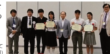
写真：国内予選入賞者の表彰式にて (2019年7月)